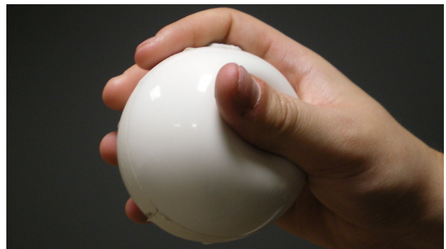
Figura 1. Dispositivo de interação.

Com o objectivo de fornecer ao utilizador uma interação natural em ambientes de larga escala, desenvolvemos um dispositivo que permite controlar de forma simples o sistema. Este dispositivo, representado na Figura 1, consiste numa bola de plástico maleável, desenhada para caber na mão de um adulto, sensível à pressão, rotação e posição no espaço. Graças à ligação sem fios, este dispositivo permite interagir livremente em ambientes de larga escala.