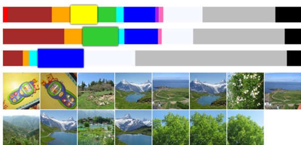
Figura 1: Exploração de imagens usando barras com distribuição das cores.

Para apresentar os resultados da interrogação, implementamos duas técnicas de visualização. A visualização por grelha de imagens segue o paradigma tradicional, onde os resultados são organizados como uma lista de itens na tela. Adicionalmente, criamos outra visualização de grelha, em que os resultados são arrumados mantendo as proporções e sem cortes. Outra técnica que desenvolvemos, dispõe as imagens ao longo de uma espiral, como ilustra a Figura 2. As imagens estão ordenadas do centro para o exterior – no centro estarão as imagens mais semelhantes ao exemplo. Além disso, as imagens mais próximas do centro terão dimensões maiores, ao passo que as imagens situadas no exterior da espiral terão dimensões mais reduzidas, reforçando a ordem pela qual se encontram.